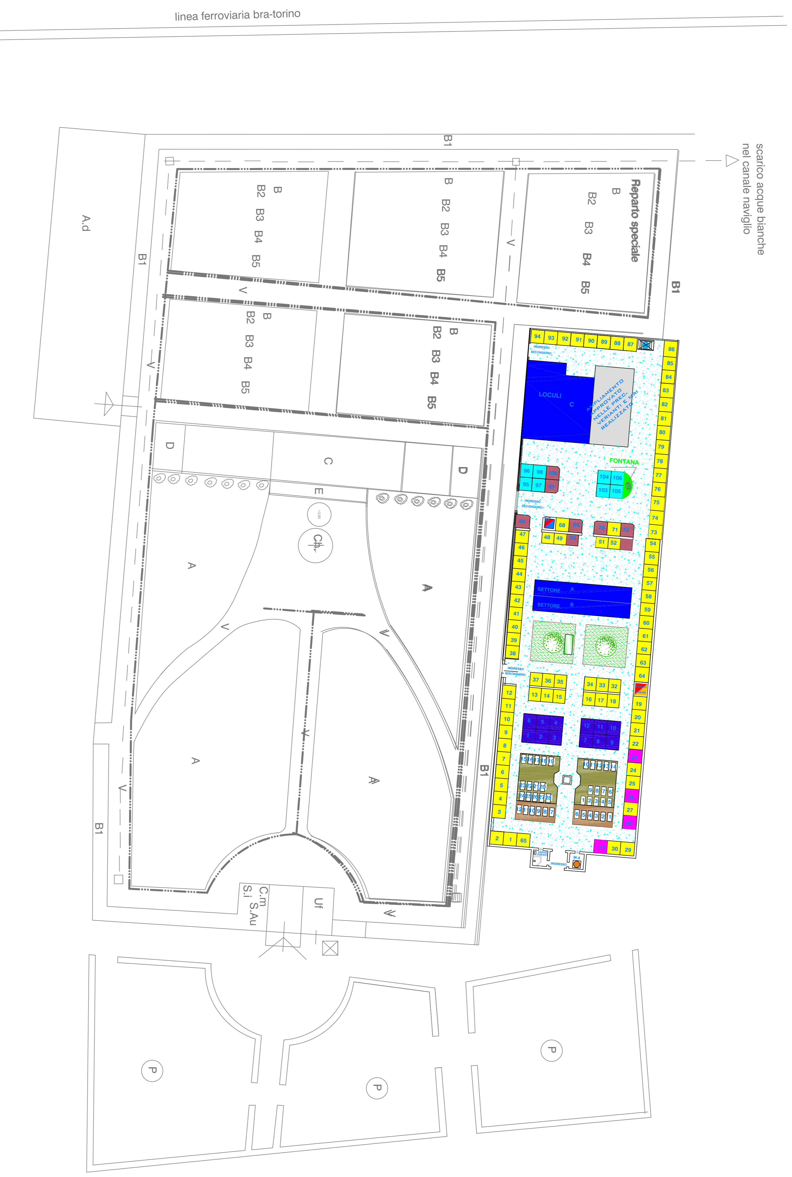
SCALA 1 : 500