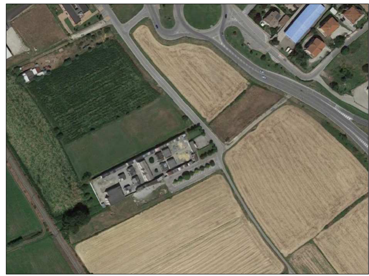
Fraz. Bandito CIMITERO COMUNALE vista aerea